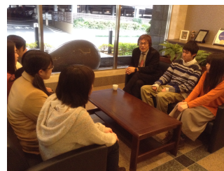
グループコーチングの様子