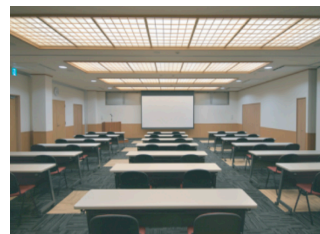
勉強しやすい教室会場