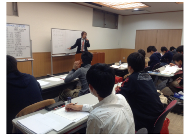
合宿ならではの総長特別講座