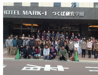
前回のマークワン合宿